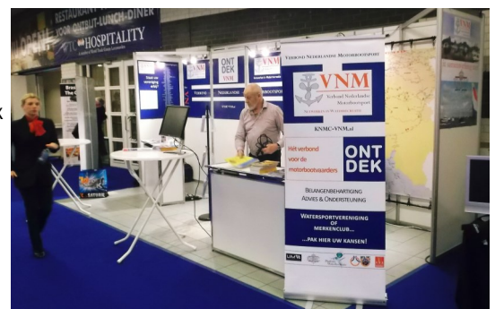
VNM en VVW zijn er klaar voor