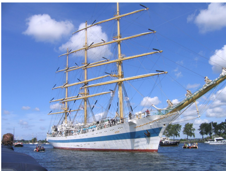
Sail Amsterdam komt eraan