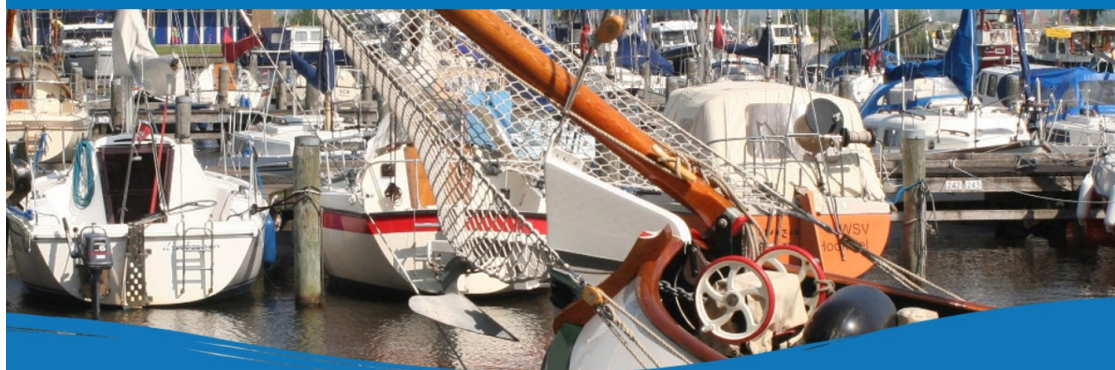
Publiek-private samenwerking voor een bevaarbaar en beleefbaar waterland.