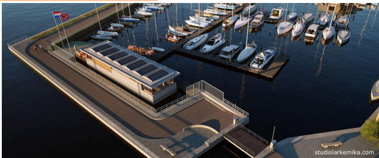
WSV Alphen aan den Rijn

PAGW (Programmatische Aanpak Grote Wateren)