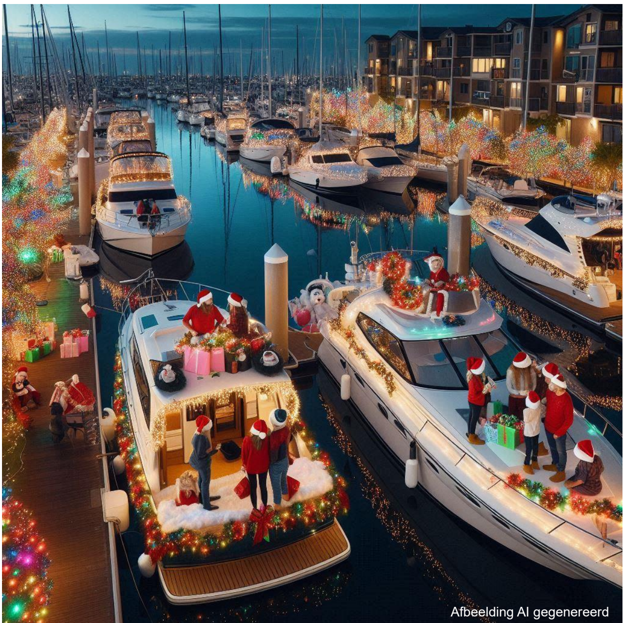
Afbeelding AI gegenereerd

Aangesloten bij het Platform Ondernemende Sportaanbieders