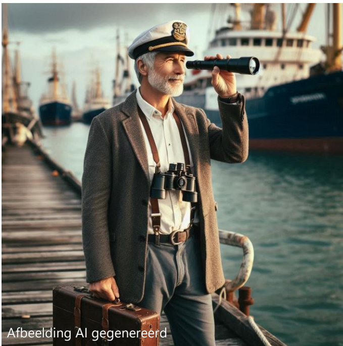
Afbeelding AI gegenereerd

De vraag is zijn er watersportverenigingen aangesloten bij het VNM of niet die een ZZP 'er als havenmeester in hebben. Zo ja, hoe kijken die ZZP 'er en die vereniging aan tegen de maatregelen van de overheid om schijnzelfstandigheid tegen te gaan. Graag uw reacties hierop sturen naar de secretaris@vnmotorbootsport.nl .